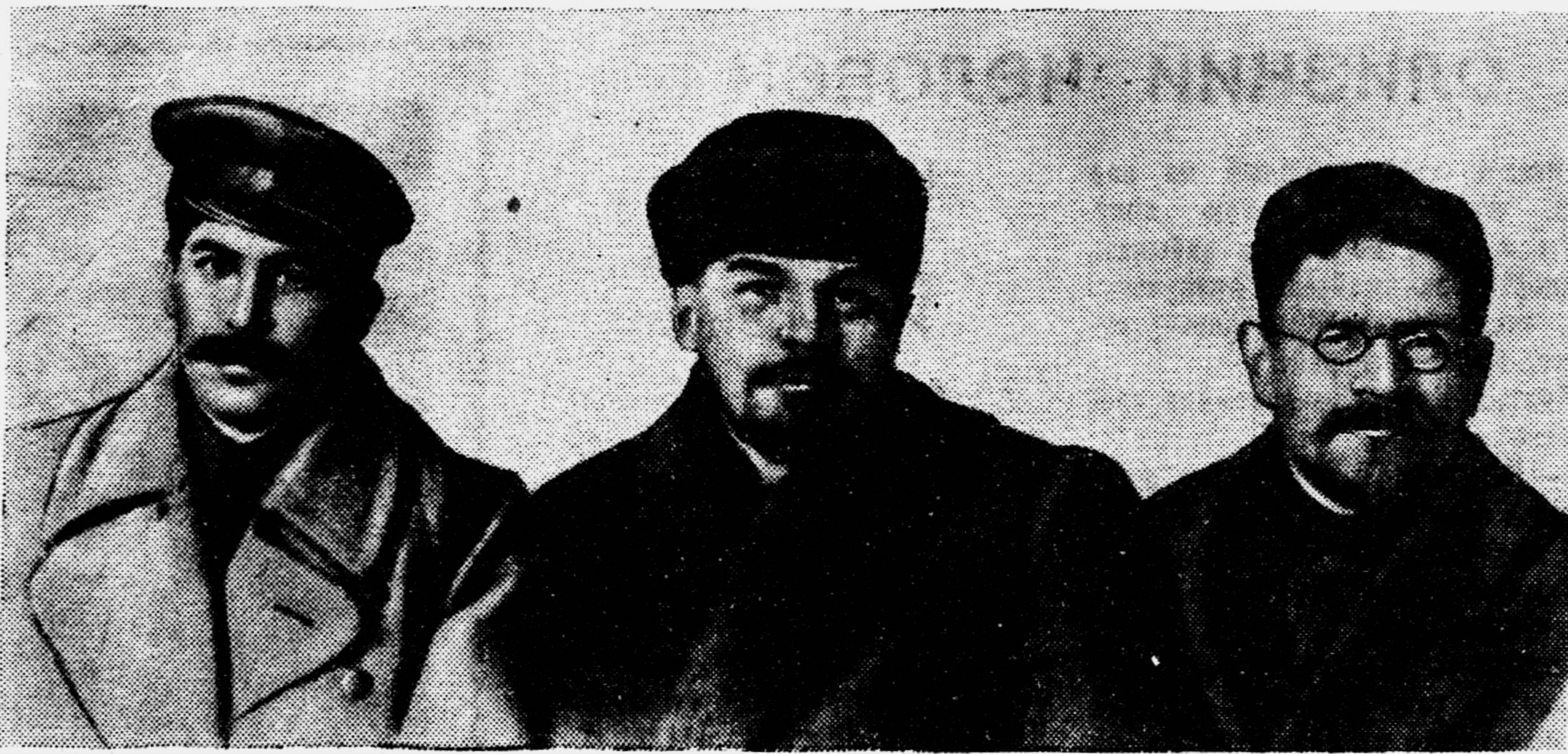
Товарищи Сталин, Ленин и Калинин на VIII съезде РКП(б) в марте 1919 года.

— Умер выдающийся деятель Советского государства Михаил Иванович Калинин. Мы, большевики Ленинского района, особенно хорошо знали Михаила Ивановича. Он неоднократно бывал у нас, выступал на районных партийных конференциях, принимал деятельное участие в работе нашей организации. Ленинская районная партийная организация всегда гордилась тем, что членом её является этот замечательный большевик, великий гражданин нашей Родины.