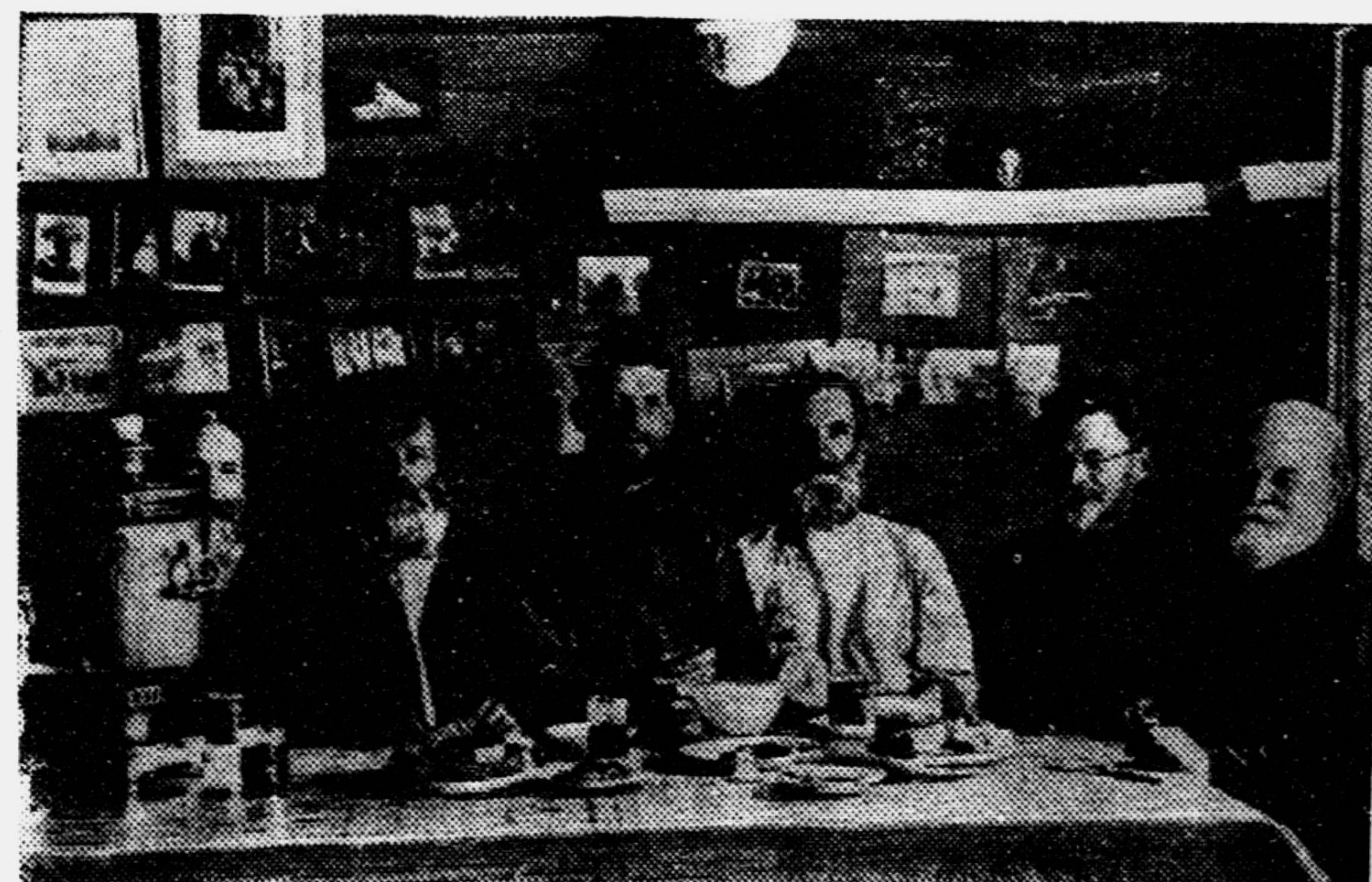
М. И. Калинин в своём родном селе среди односельчан.