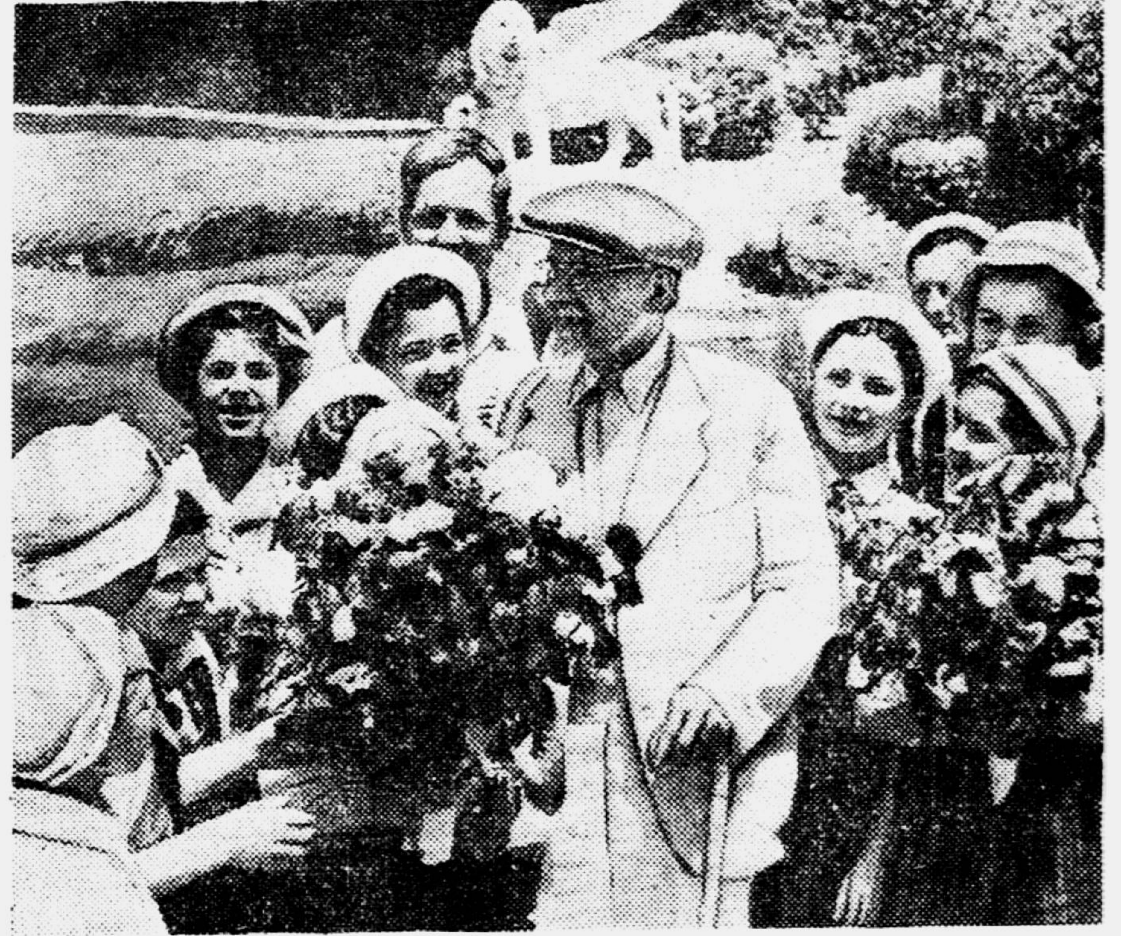
Михаил Иванович Калинин среди пионеров-артековцев.