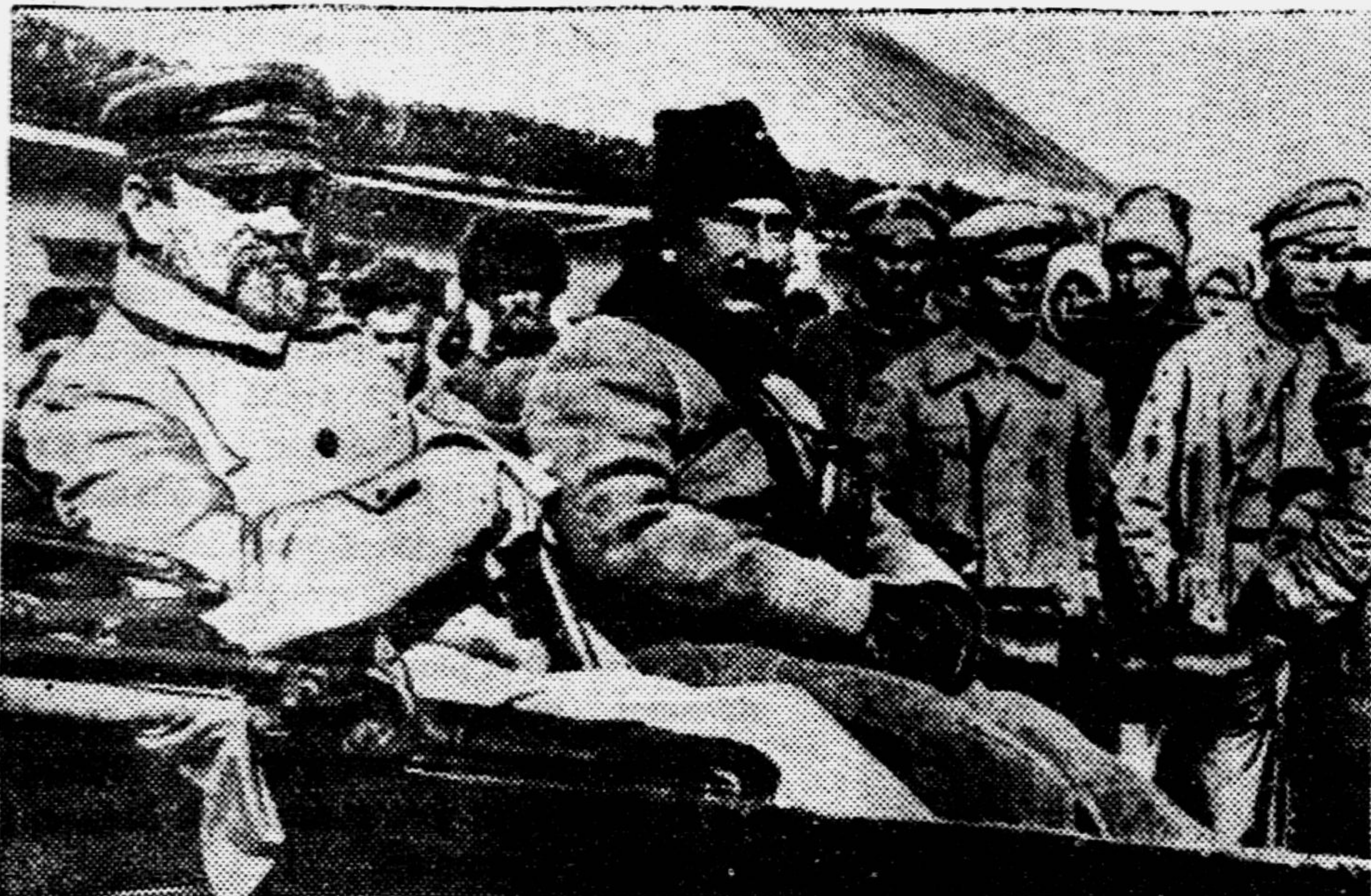
Товарищ М. И. Калинин (слева) во время гражданской войны — в чинах Первой Конной армии. Рядом с ним в автомобиле сидит С. М. Будённый

Жизнь Михаила Ивановича была и будет примером для всех нас!